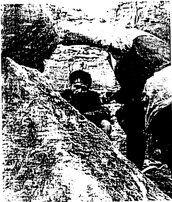
L'utilisation de l'explosif pour dégager des accès obstrués est un art difficile. Les spéléos s'y sont initiés, ce week-end, dans une carrière du Tonnerrois.

Le week-end dernier, une quinzaine d'adhérents de la ligue spéléologique de Bourgogne ont expérimenté, dans la carrière de Saint-Martin-sur-Armançon, dans le Tonnerrois, des techniques de minage à l'air libre pour faire sauter les verrous rocheux qui empêchent soit la progression, soit l'acheminement des secours en milieu souterrain.