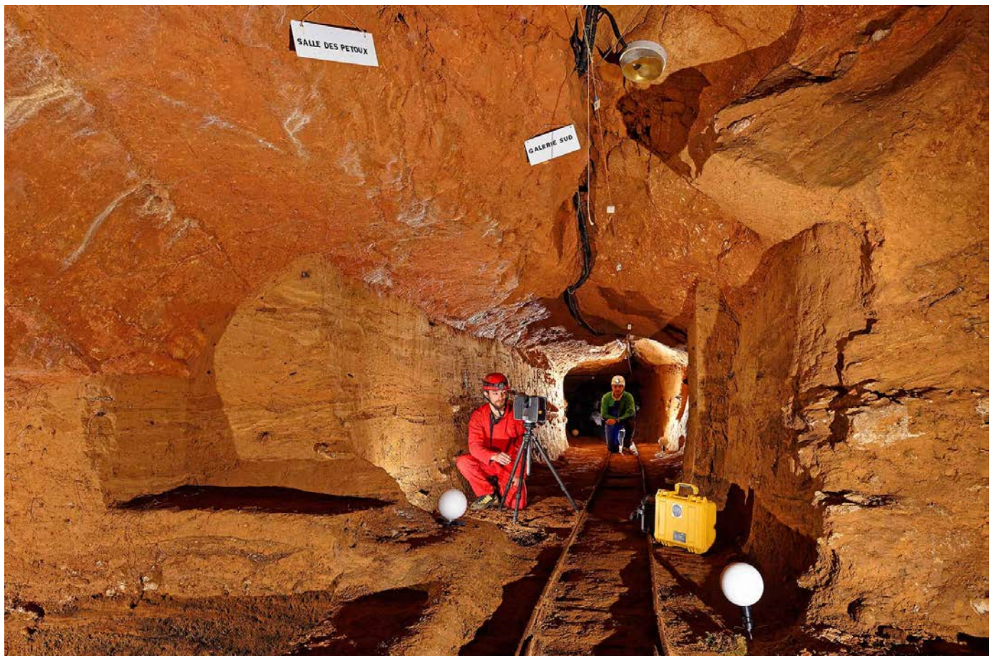
Azé, Galerie des Aiglons, désobstruée par un groupe d'enfants

Les présentations se tiendront à la Salle des Fêtes d'Azé, au centre du village. Le dimanche après-midi sera consacré aux visites des Grottes d'Azé.