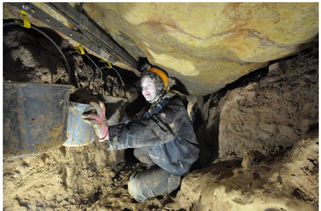
Azé, désob au fond de la grotte Préhistorique, 2017